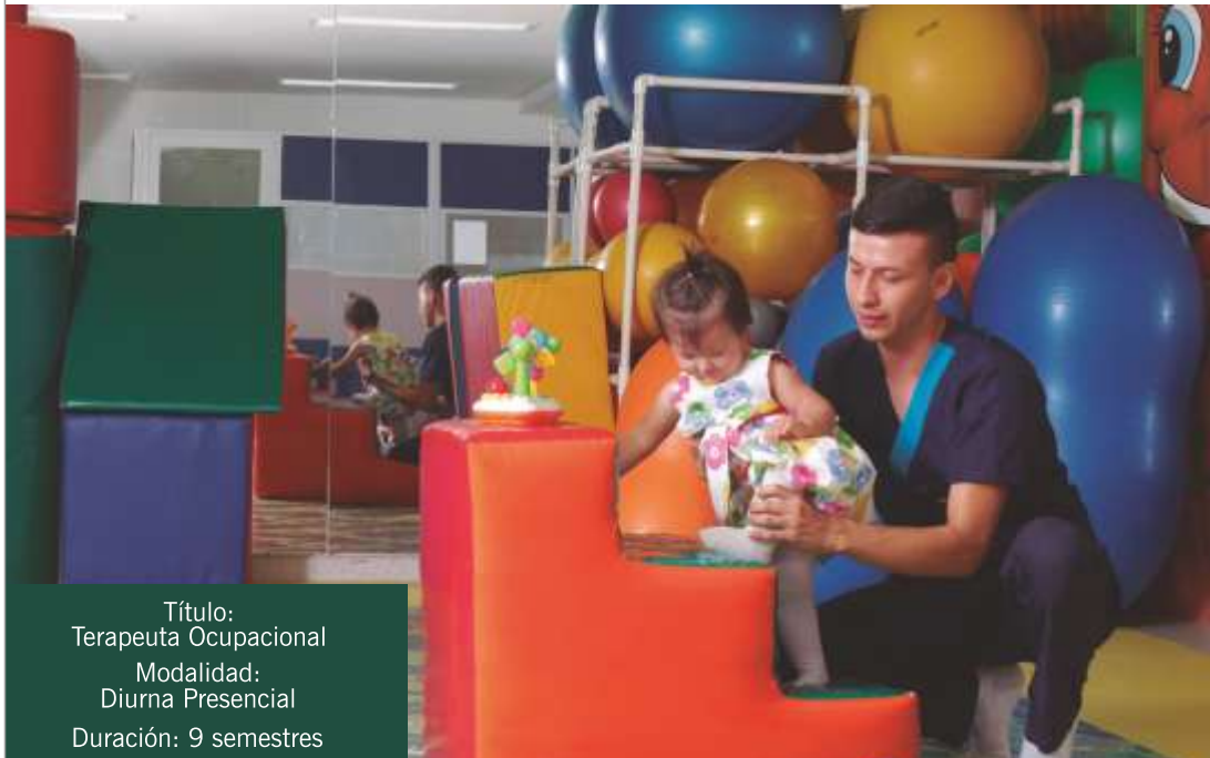
Título: Terapeuta Ocupacional Modalidad: Diurna Presencial Duración: 9 semestres